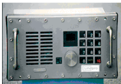
Lindpros vandtætte radio til Fast Rescue Boats

Lindpro Esbjerg leverer og servicere kommunikations- og sikkerhedsmateriel til skibs- og offshorebrug. Vi er autoriseret Motorola-distributør og forhandler blandt andet de eksplosionssikrede og solide bærbare Motorola Cenelec (EX) radioer, der er godkendt til brug på Nordsøens olierigge og platforme.